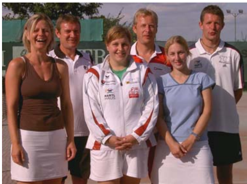
die erfolgreichen Damen 2008

Vom 13. – 16. August wird Einzel gespielt und vom 21.-23. August stehen die Doppel -Meisterschaften auf dem Programm. Für die Jugend gibt es entsprechende Bewerbe. Bitte nützen sie die Gelegenheit, um sich mit Kollegen und Freunden zu messen. Es gibt für jede Spielstärke den geeigneten Bewerb. Nennlisten liegen ungefähr 2 Wochen vor Beginn in der Tenniskabine auf. Die Nennung ist auch jederzeit telefonisch bei den Funktionären möglich