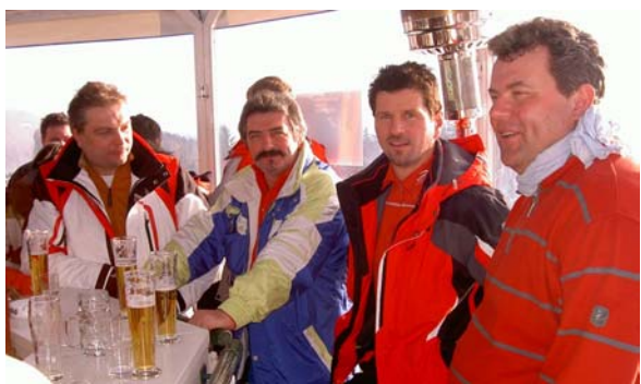
ein Einkehrschwung durfte nicht fehlen

Am 14. Februar erlebten 40 Teilnehmer einen tollen Schitag am Hochficht. Nach anfänglichem Schneetreiben klarte es auf und man konnte herrliches Schiwetter genießen.