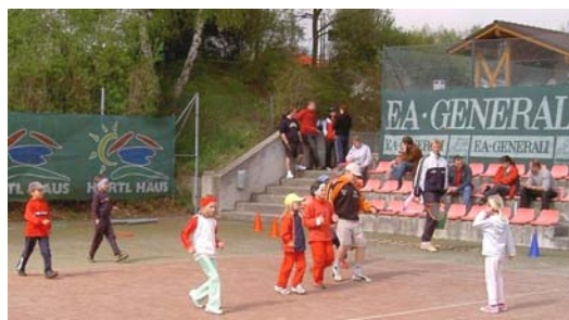
spielend wird den Kinder Tennis beigebracht