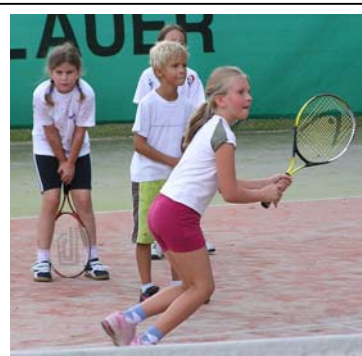
.. die Kinder am Tenniscamp

Bei Fragen oder Interesse bitte um Kontaktaufnahme direkt mit den Trainern