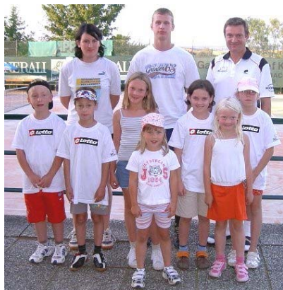
die Tenniszukunft des UTC