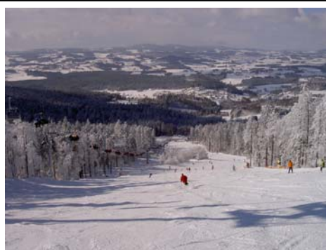
Traumwetter am Hochficht