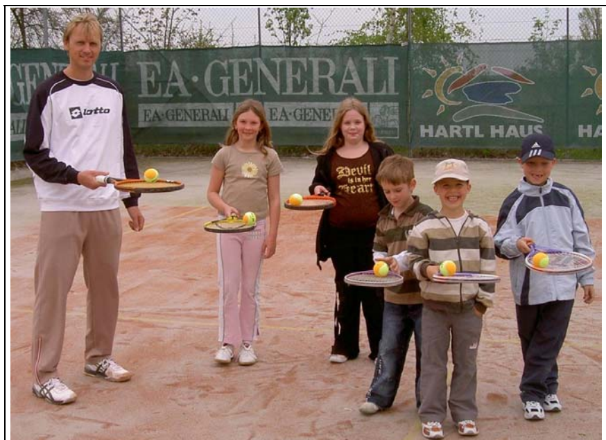
Familientennistag – die Kinder hatten Spaß beim Training