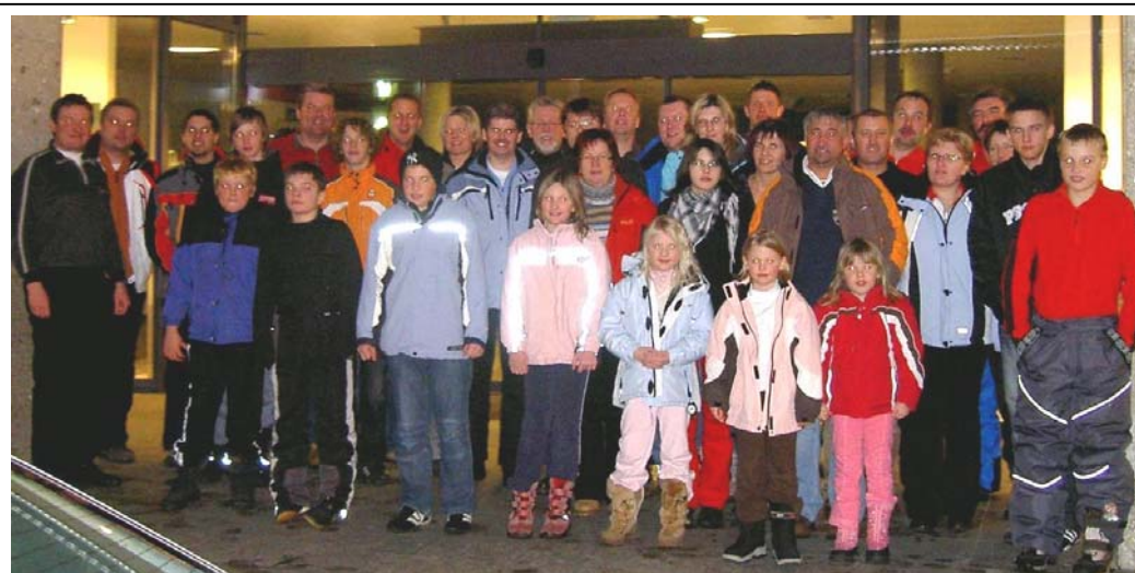
müde Gesichter bei der Rückreise vom Hochficht