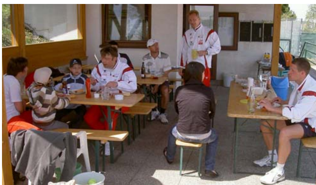
Mittagspause beim Familientennistag

Unter dem Motto „ Ganz Österreich spielt Tennis “ wurde heuer zum 3. Mal diese Aktion des NÖTV durchgeführt. Der UTC Echtsenbach verbindet dies gleichzeitig mit der offiziellen Saisonöffnung. Zahlreiche interessierte Spielerinnen und Spieler konnte man am Tennisplatz antreffen. Neben einem sportlichen Rahmenprogramm für Alt und Jung (Kostenloses Schnuppertraining mit geprüften Tennislehrern, Mehrkampf-Parcours für Kinder) gab es auch kulinarisches vom Holzkohlegrill.