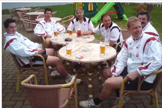
kurze Erholung nach dem harten Training

Die Erwartungen wurden erfüllt. Professionelle Trainer gaben ihnen den letzten Schliff. Auch das „Rundherum“ (Hotel, Verpflegung, Tennisanlagen) übertraf die Erwartungen. Eine Fortsetzung im Jahr 2010 wird folgen.