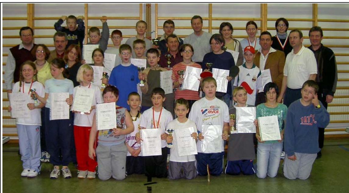
Die Gewinner des Abschlußturnieres