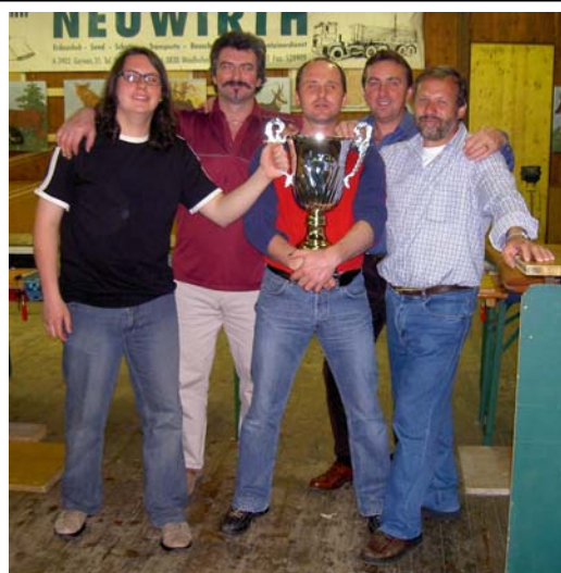
die Meisterschützen vom TCE