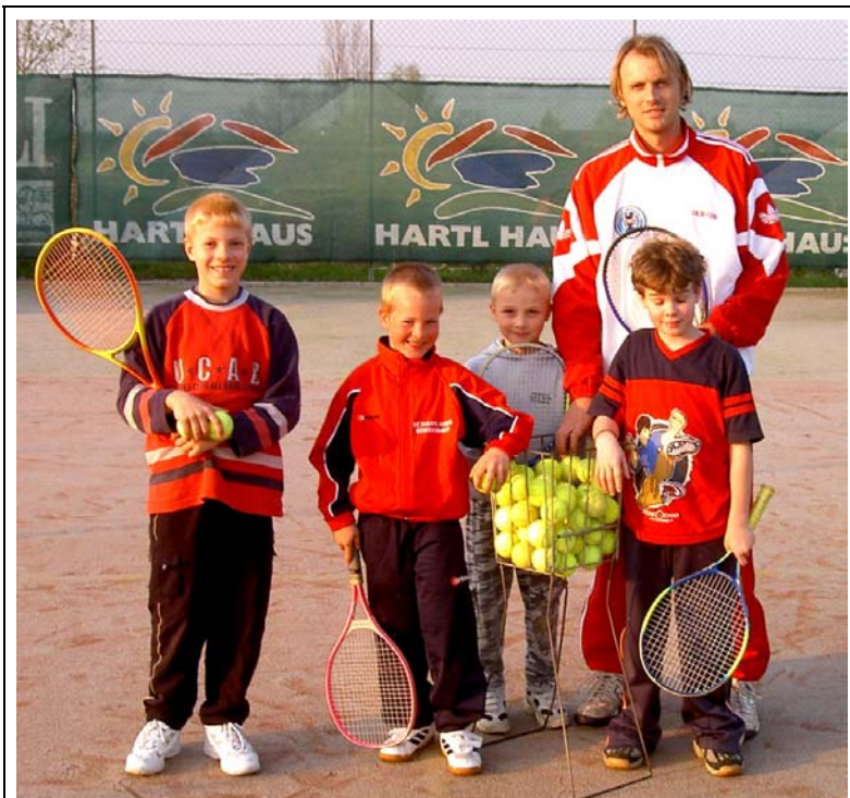
Eine Gruppe beim Kindertraining