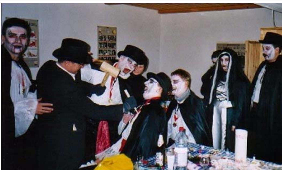
Großes Aufsehen erregten die Vampire des UTC Echsenbach beim heurigen Faschingsumzug