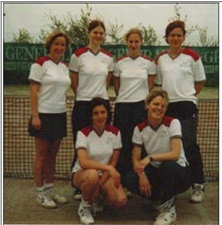
Die Damenmannschaft kämpft in der Meisterschaft um den Klassenerhalt