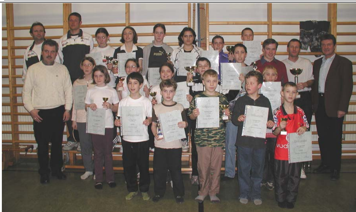
Die Gewinner des Abschlußturnieres