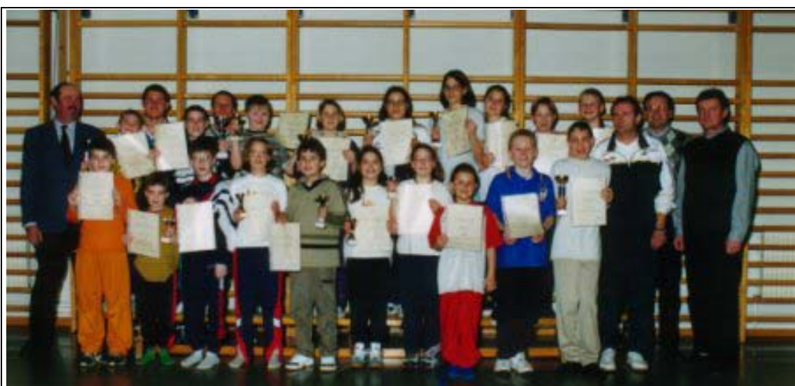
Die Gewinner des Jugend-Abschlußturnieres

Der UTC Echsenbach möchte sich noch einmal recht herzlich bei den Organisatoren für den Einsatz den ganzen Winter hindurch und für die Abhaltung des Abschlußturnieres bedanken. Ein Dankeschön der Marktgemeinde Echsenbach, die dem Tennisverein alljährlich die Turnhalle zur Verfügung stellt, ebenso allen Pokalspendern und Allen, die zum guten Gelingen der Veranstaltung beigetragen haben.