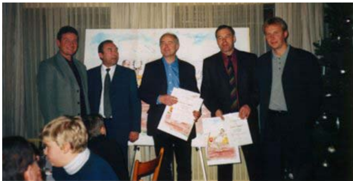
Die scheidenden Funktionäre, eingebettet von der neuen Vereinsführung